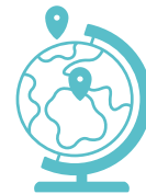
L'intervention sociale à l'international

La volonté d'être reconnue comme un lieu de référence du champ de l'Intervention sociale a tout naturellement amené l'Association à s'engager dans une démarche qualité et de développement durable depuis 2015 avec l'obtention de plusieurs labellisations dont PVE, OPQF et plus récemment QUALIOPI. 2022, représente un nouveau tournant, où le périmètre de la qualité s'étend à l'ensemble des activités dans le cadre du projet de certification ISO 9001.